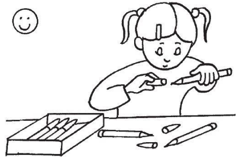
ranger le matériel