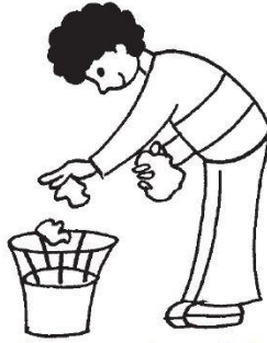
jeter les papiers à la corbeille