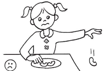
ne pas jeter la nourriture

Enfin, nous avons appris plein de chansons et de comptines :