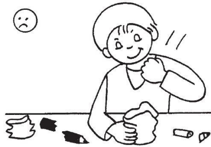
ne pas casser le matériel