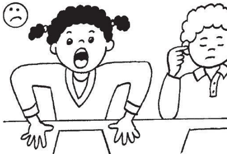
ne pas hurler