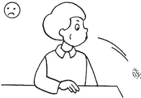
ne pas cracher